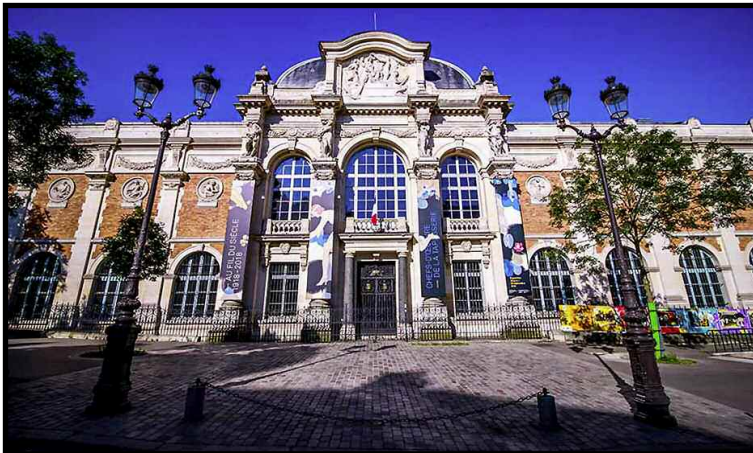
La Manufacture des Gobelins. Au début du 15 e siècle, Jehan Gobel, originaire de Reims, crée un atelier de teinture faubourg Saint-Marcel puis acheta un terrain sur le bord de la Bièvre. Toujours en activité à ce jour (XIII e ).