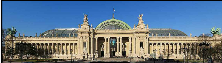
Le « Grand Palais des Beaux-Arts » est édifié à Paris à partir de 1897, pour l'exposition universelle prévue du 15 avril au 12 novembre 1900. Il a été entièrement restauré entre 2001 et 2007 (VIII e ).