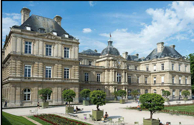
Le Palais du Luxembourg, siège du Sénat français installé en 1799, fut construit sur l'ancien hôtel du Luxembourg (VI e ).