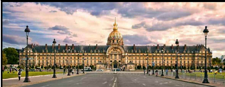
La construction des Invalides remonte au XVII e siècle, Elle a été ordonnée par Louis XIV en 1670 dans le but d'accueillir les soldats invalides de ses armées. Siège du gouverneur militaire de Paris, l'élément principal est le tombeau de Napoléon (VII e ).